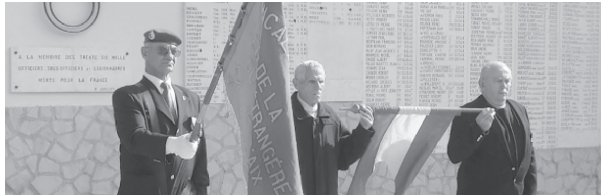
Patria Nostra – film

A ligeti tölgyóriások közt guggoló szőke kislány messziről olyanok tűnt, mint egy kincset ásó, apró manó. Egy vékony ággal piszkálta a száraz levélhalmot, aztán két kezével is belemarkolt a zörgő kupacba. Édesanyja egy távolabbi padról figyelte. Percekig vártam, hogy a finom arcú, szemüveges nő megszólaljon, pedig már hetek óta megegyeztünk, hogy elmeséli történetüket.