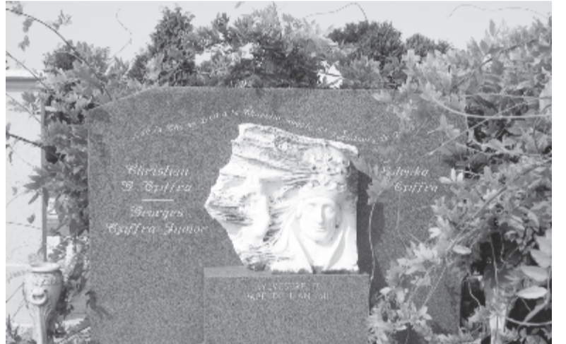
Cziffra György sírja Senlisben

A pesti srácok hősiességének híre bejárta a világot. Későbbi sorsukról viszont lényegesen kevesebbet tudunk. A Patria Nostra – '56-os menekült kamaszok a francia idegenlégióban című dokumentumfilm azoknak a fiataloknak a to-