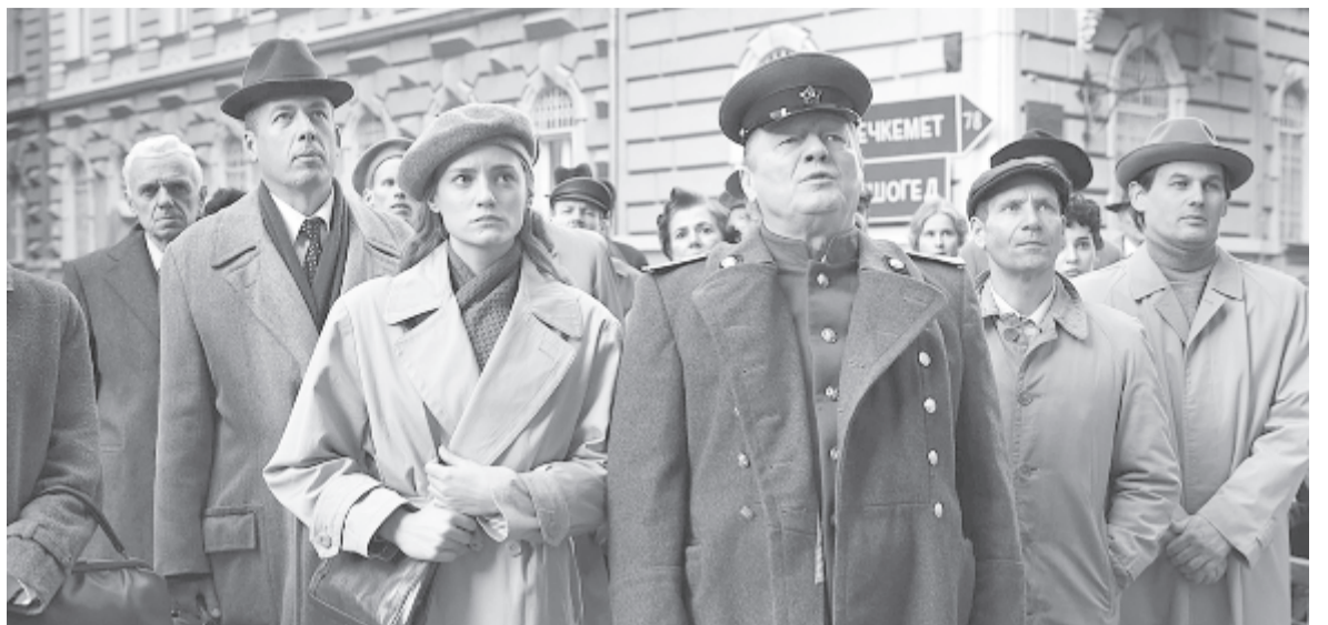
Árulók – film